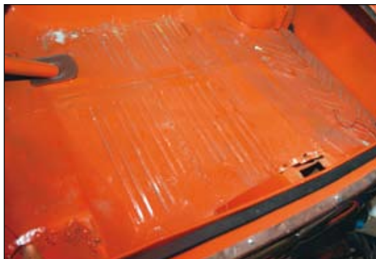
Skuffgolvet är bytt. Detta är svetsat i två delar direkt ovanpå delar av det gamla golvet, och sedan täckt av ett tunt lager färg.