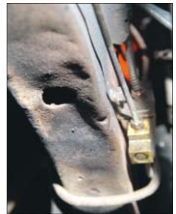
Brottsanvisning på rambalk, vänster sida vid framvagnsinfästning.

- Det där att det skulle vara en rostfri bil; jag tror inte att han kan komma och säga något annat. Om vi nu tittar igenom bi-