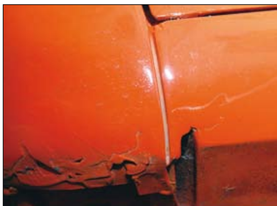
Spalten mellan sparklåda och framskräm på vänster sida mäter cirka två cm. Denna är fylld med spackel, därefter har en ny spalt slitsats på ungefär rätt ställe med kapskiva i spacklet.