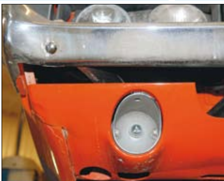
Spalt mellan kofångare och front mäter runt fem centimeter på vänster sida, cirka fem millimeter på höger. Fronten i övrigt har tydliga rosthål samt är grovt spacklad.

-Jag har inte tagit ställning till det än, utan det är i princip så, att när det uppstår ett fel så att säga, om det nu är ett papper eller det är nåt fel på bilen eller någonting mellan säljare och köpare, så har säljaren en viss tid att rätta till det och åtgärda