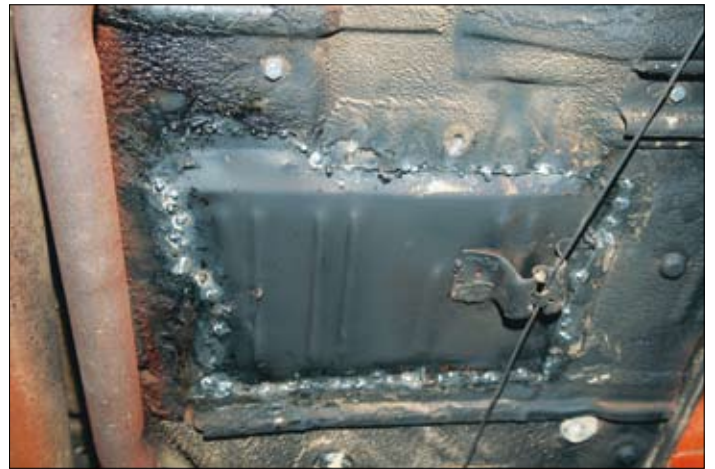
Golvsplåt, höger balja bakom stol är bytt.

Sen har vi tagit del av en värdering utförd av en oberoende besiktningsman från Stockholms handelskammare, och han har värderat bilen till 100 000 kronor, och tagit upp mycket brister, det står att den är knäckt i ramen och så vidare. Det svarar ju inte riktigt emot vad annonsen förtäljer?