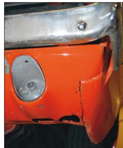
Tydliga rostangrepp, delvis dolda med spackel.