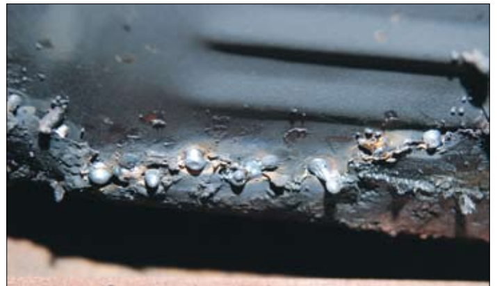
Svetsning utförd av Wasabil, golvsplåt vänster fram.