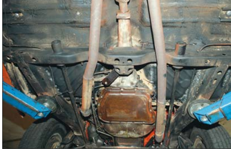
Golvplåtar förefaller ha slitits loss från original fästpunkter. Dessa är sedan grovt punktsvetsade. Växelföraren är hemmagjord.