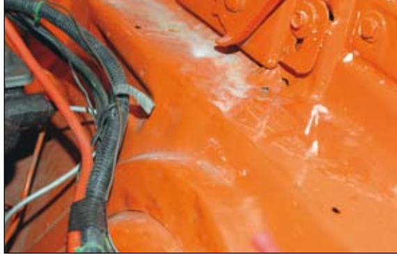
Inner-skärm vänster fram är knäckt samt grovriktad.