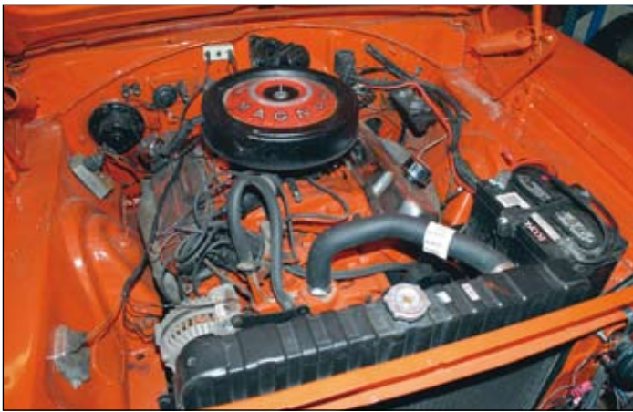
440 från 1974. Utlovad MSD-tändning saknas.