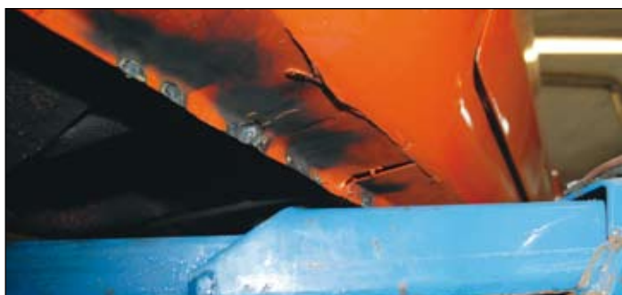
Bägge sparklådorna är bytta. De satt med fem till sju punktsvetsar per sida, samt skruv i överkant. Wasabil har sedan punktsvetsat ytterligare.