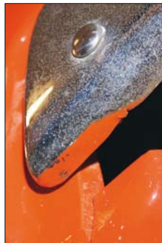
Lackarbetet visar på bristfällig maskering.