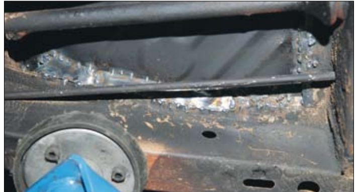
Plätremsa punktsvetsad mellan balk och golvplåt.

felet enligt konsumentköplagen. Så där är vi just nu, jag ska gå igenom bilen och jag ska titta på den. Vi har tyvärr inte lagt ner något arbete på motorn som inte går riktigt som den ska, eftersom den skulle bytas. Men nu står bilen här, så nu måste vi gå igenom och fixa felen. Men jag vill förklara att vi har inte gjort det beroende på att han skulle köpa en ny motor och ett nytt avgassystem, bland annat. Men eftersom den står här måste fortsätta att göra bilen enligt avtalet.