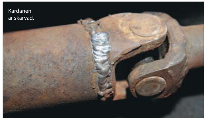
Kardanen är skarvad.