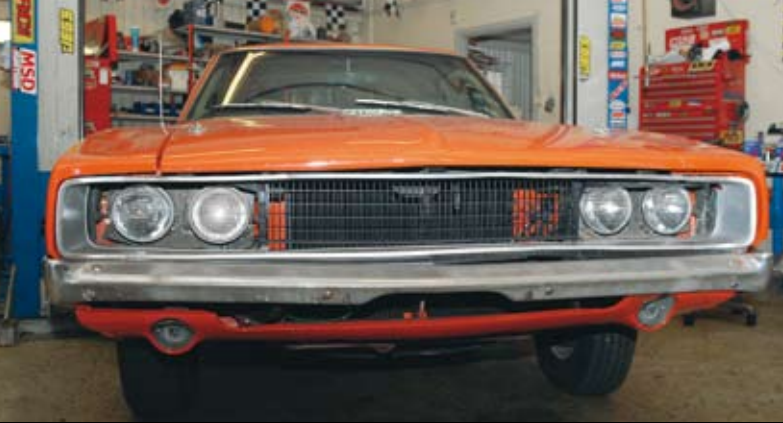
Fronten är snett vriden uppåt i vänstra hörnet. Huvspringan är cirka två centimeter på vänster, cirka två mm på höger. Stötfångaren är porig, fronten i övrigt sliten.