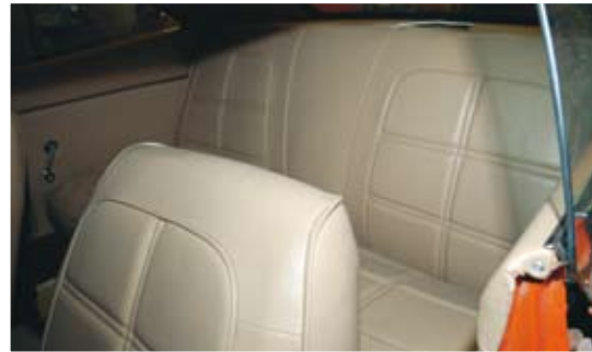
Klädseln är nyttillverkad och bytt, även innersätet. Hastighetsmätaren ändrad till kilometerskala med textad pappskiva.